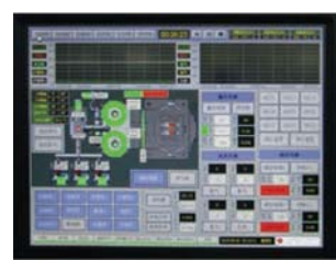
Система управления: Интерфейс человек-машина (HMI)