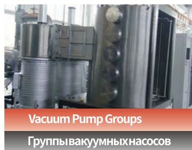
Vacuum Pump Groups