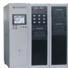
Control System: Human Machine Interface (HMI)